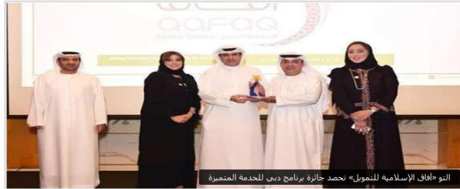
التو «آفاق الإسلامية للتمويل» تحصد جائزة برنامج دبي للخدمة المتميزة

الأحد 23 سبتمبر 2018 05:14 مساءً | نشرين مذكور | أخبار عربية | تليغ | حذف